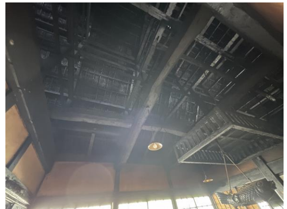
古民家 1 小屋組