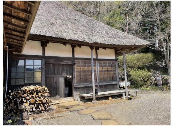
古民家 1 外観