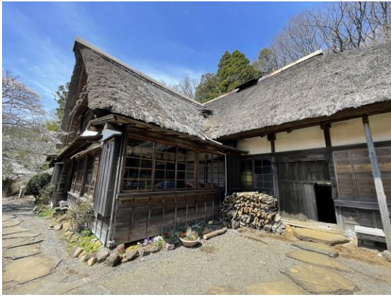
古民家 1 外観