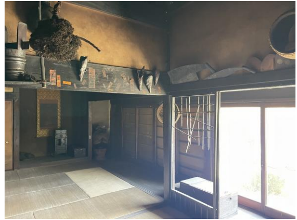
古民家 2 内観