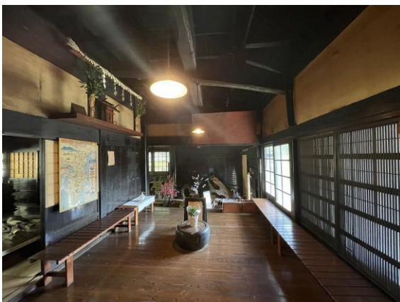
古民家 1 板間