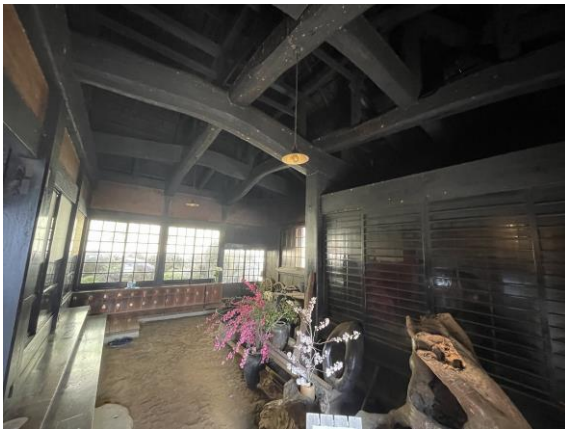
古民家 1 土間