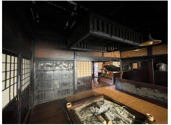
古民家 1 囲炉裏