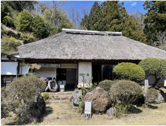
古民家 2 外観